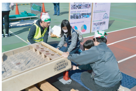
↑ジャッキアップ体験の様子

主催の一寺言問を防災のまちにする会は、百年後(子どもたちに残せるまち)を目指して、地域で取り組む防災活動を展開しています。今回の防災訓練への活動もその一環です。その他にもいろいろな活動を行っていますので、「興味のある方はぜひ会合にお気軽に参加してください。」 次回の会合は1月16日(火)です。