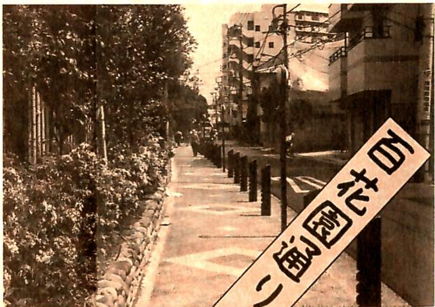
完成した百花園通り「寺島のみち」