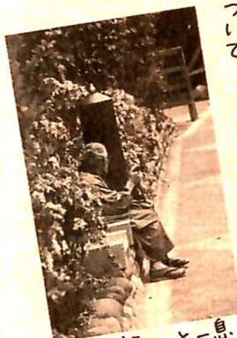
パンチぞりよと一息