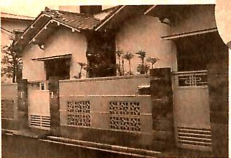
土塀色に吹き付けた塀に、白鼠と息吹きが模様になって、寺島のみちとよく似合います。

緑化した百花園の前の緑が色濃くなって、道もきれいにしてくださいました。外壁など我が家も手入れすることにしました。寺島のみちの労働長に合わせると、職人さんに頼みましたら、塀を工夫してくれました。門も木をそのまま活かしました。