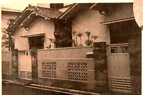
土塀色に吹き付けた塀に、白鼠と息吹きが模様になって、寺島のみちとよく似合います。

緑化した百花園の前の緑が色濃くなって、道もきれいにしてくださいました。外壁など我が家も手入れすることにしました。寺島のみちの労働長に合わせると、職人さんに頼みましたら、塀を工夫してくれました。門も木をそのまま活かしました。